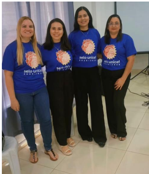
26/09/2025: Treinamento da equipe da Secretaria Municipal de Assistência Social no novo sistema de interno de informações.