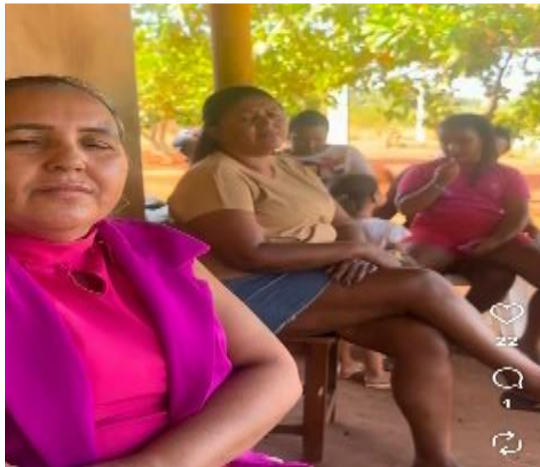
Reunião com as mulheres Contempladas no programa ATER Mulher e ATER Convencional