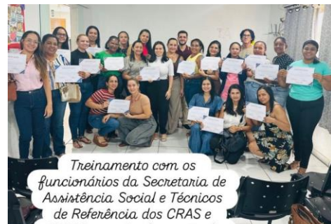
Treinamento com os funcionários da Secretaria de Assistência Social e Técnicos de Referência dos CRAS e CREAS para Implantação do Novo Sistema Interno de Atendimentos.