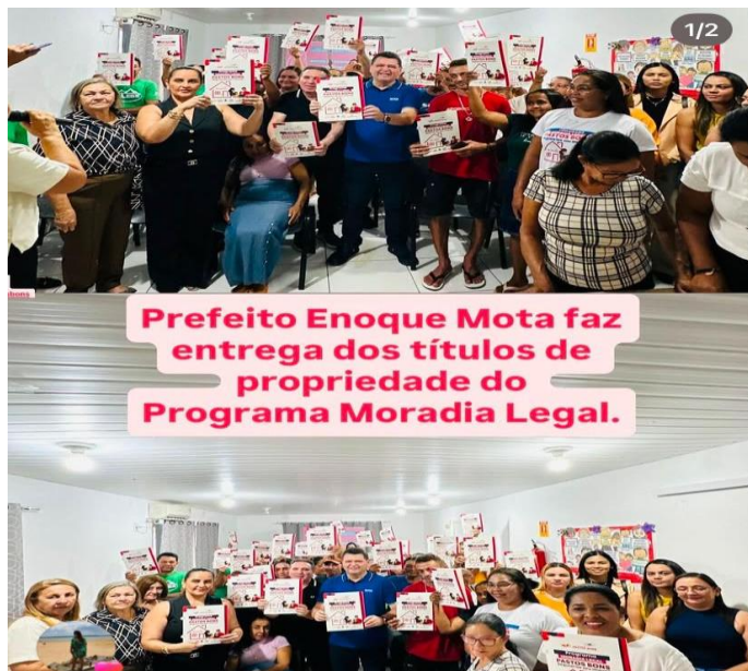
Palestra sobre Violência Doméstica com o grupo do PAIF- Poirão