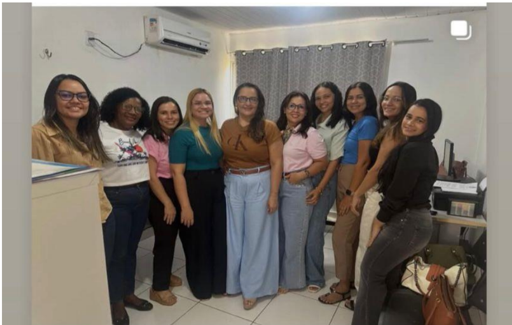
24/11/2025: Reunião de alinhamento do I Fórum Comunitário do Selo Unicef 2025 a 2028.