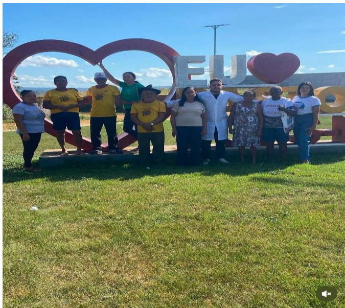
Semana do Bebê do CRAS Poirão