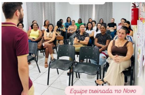
Equipe treinada no Novo Sistema Interno de Atendimento.