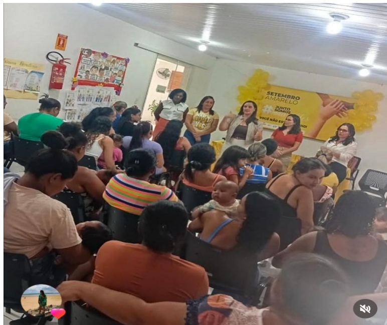
Atividade com o Serviço de Convivência e Fortalecimento de Vínculo-SCFV da pessoa idosa