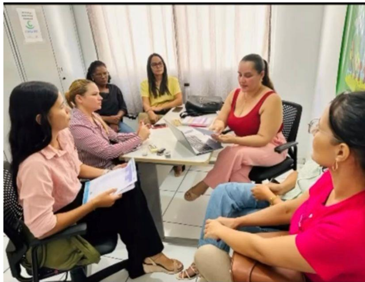
27/11/2025: I Fórum Comunitário do Selo Unicef 2025 a 2028.