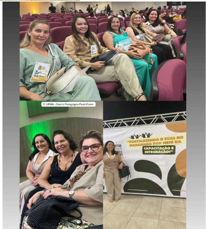
16/04/2025: Reunião de alinhamento dos serviços com a equipe do CREAS.